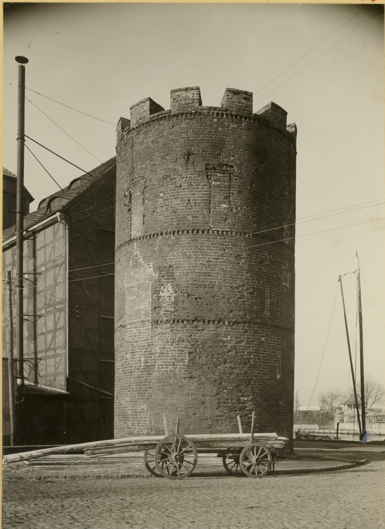
Greifswald Fangelturm, 13. Jh.