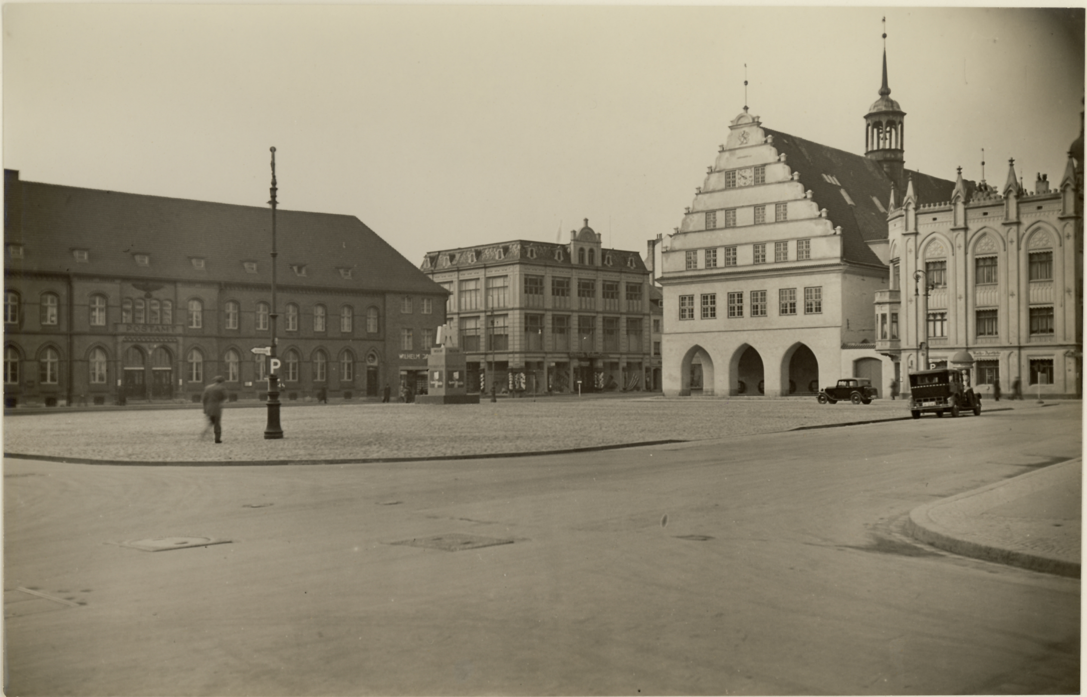
Greifswald, Pomm., Greifswald, Marktplatz mit Rathaus und Postamt