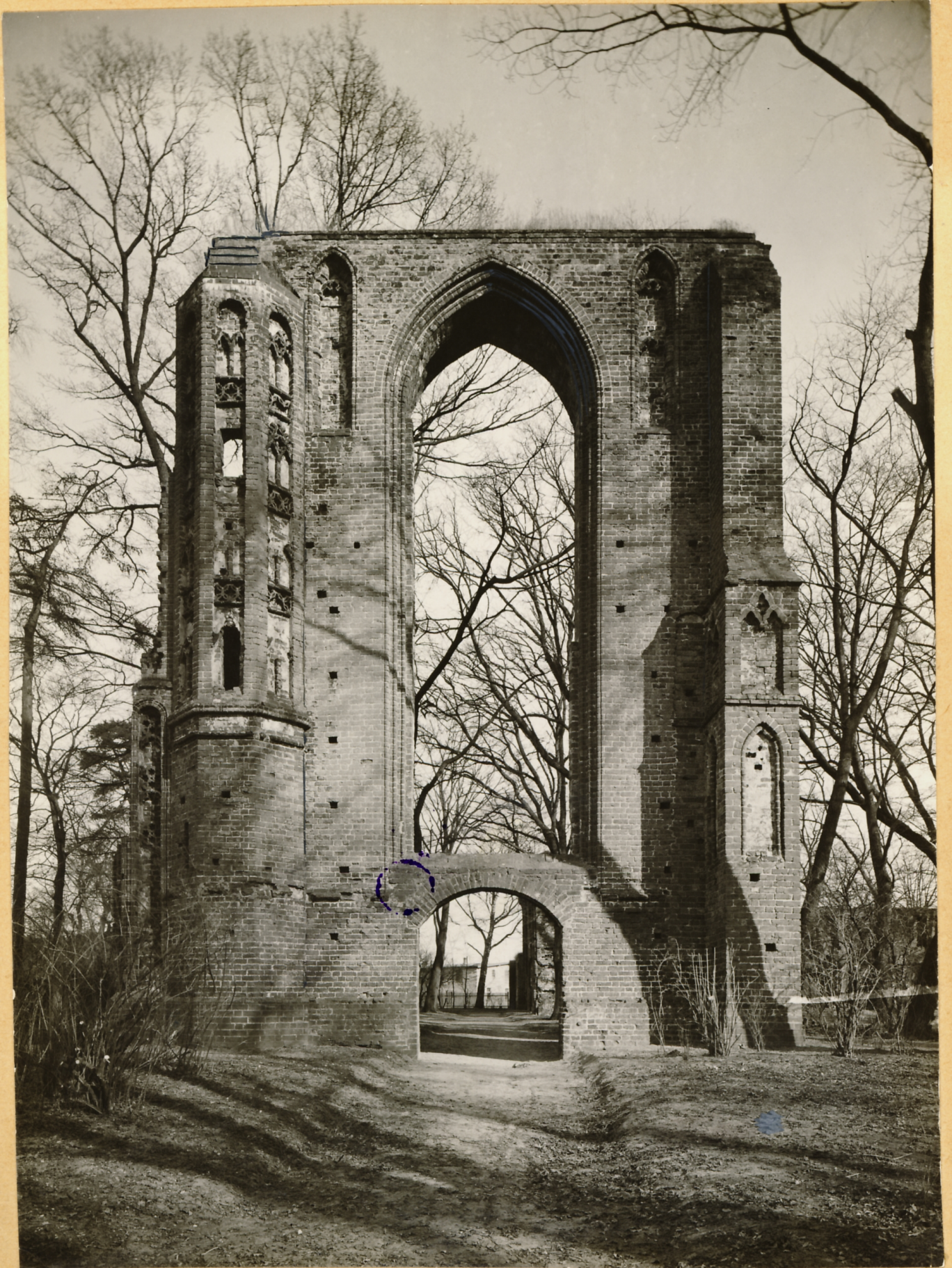
Die Klosterruine Eldena Westfassade der Kirche.