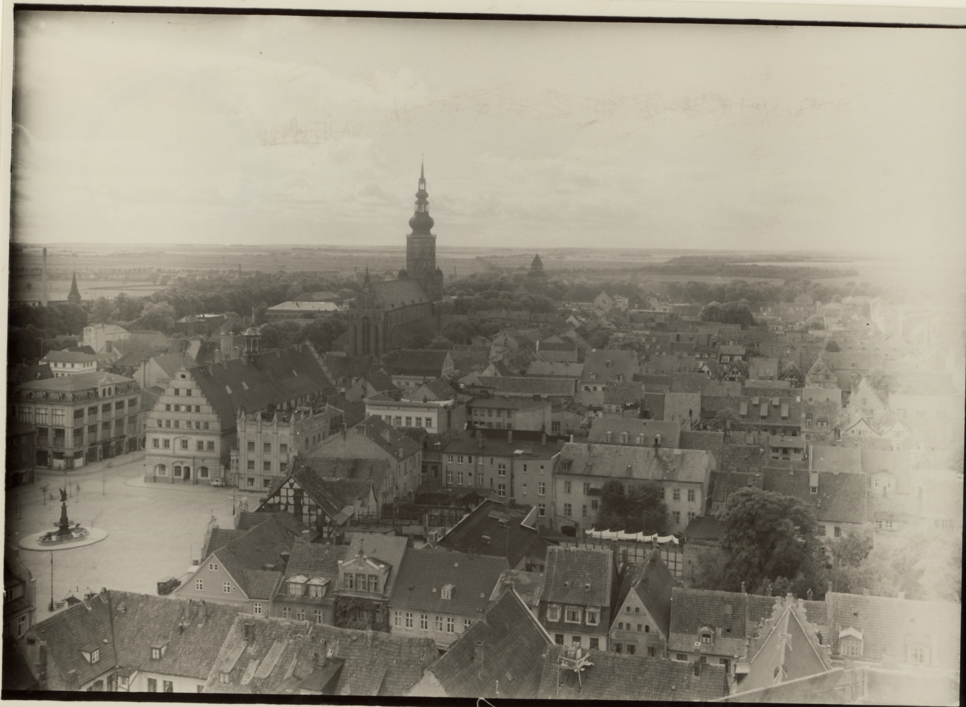
Greifswald Stadtansicht von NO