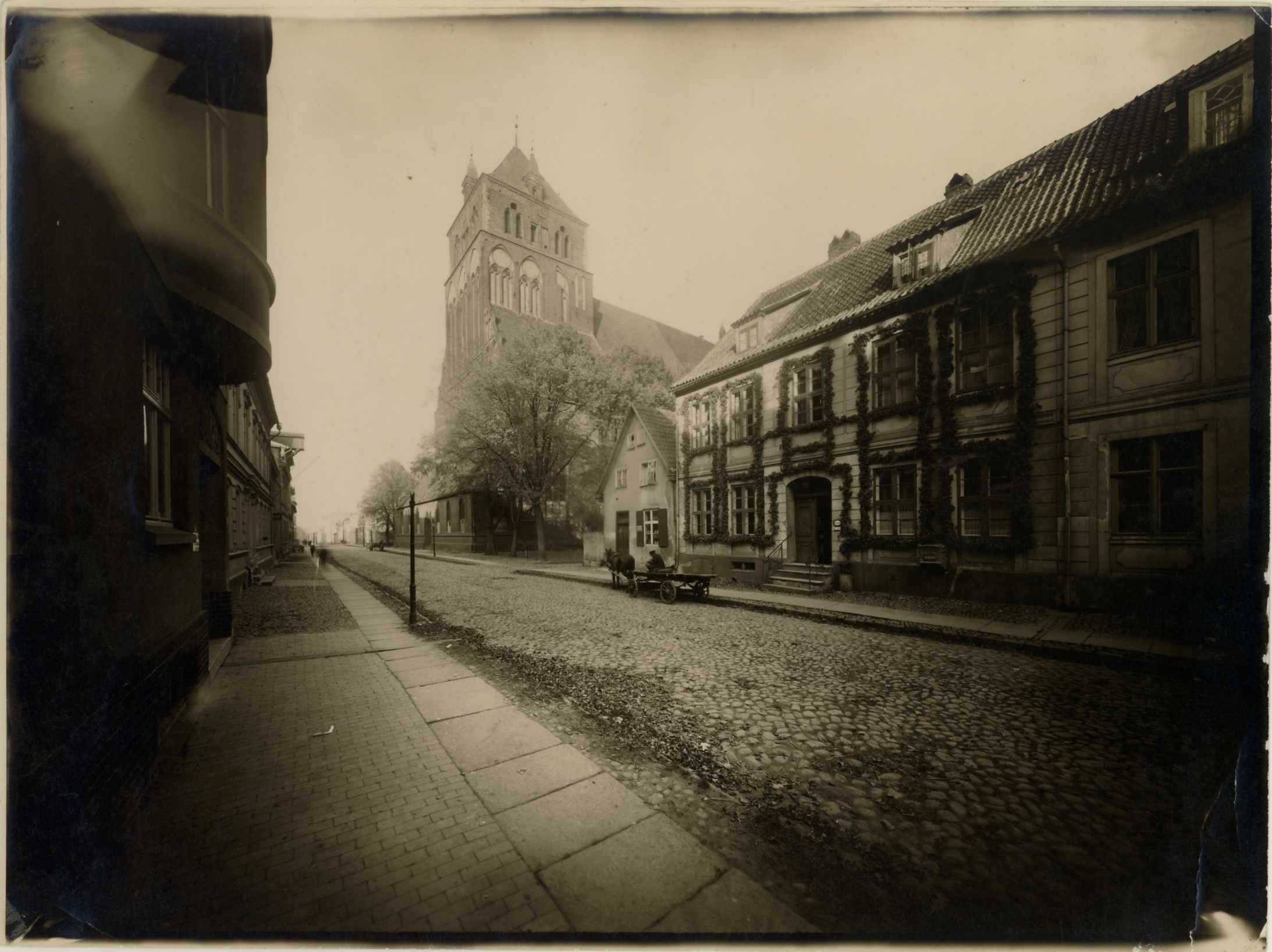
Greifswald, Pomm., Greifsw., Brügstraße mit Pfarrkirche St. Marien