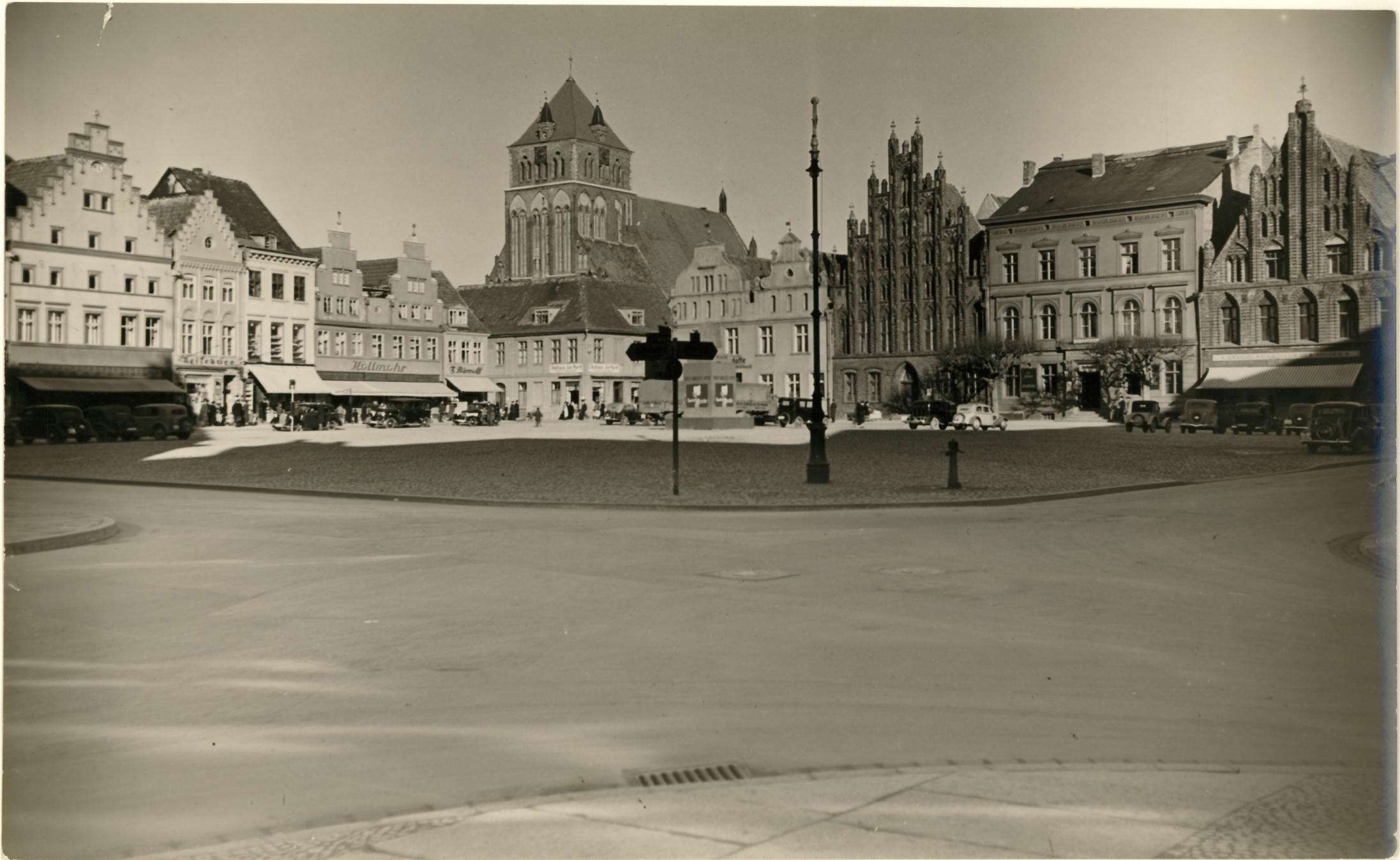
Greifswald, Pomm., Greifswald, Marktplatz mit Blick zur St. Marien-Kirche