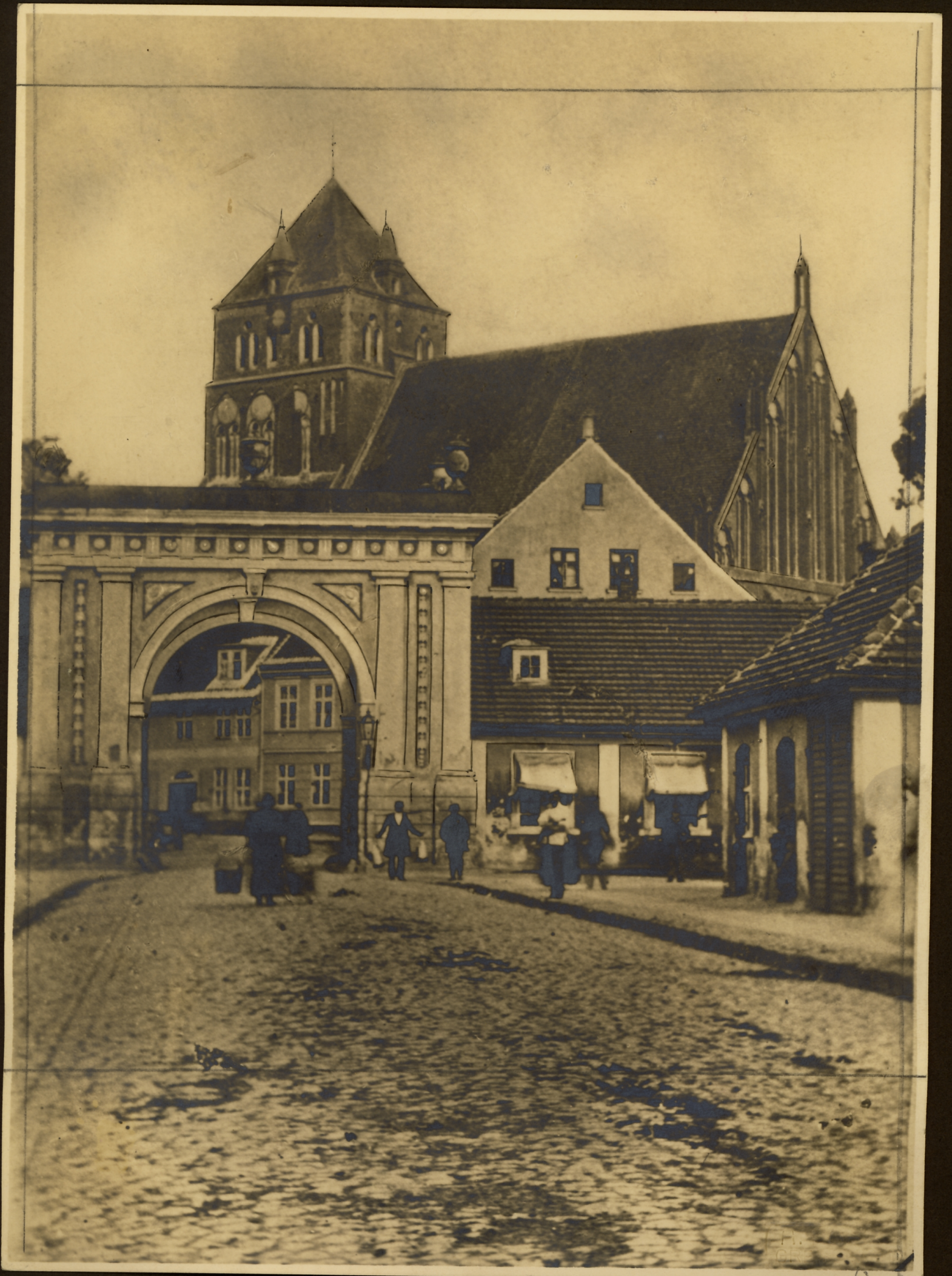
Mühlentor v. Quistorp