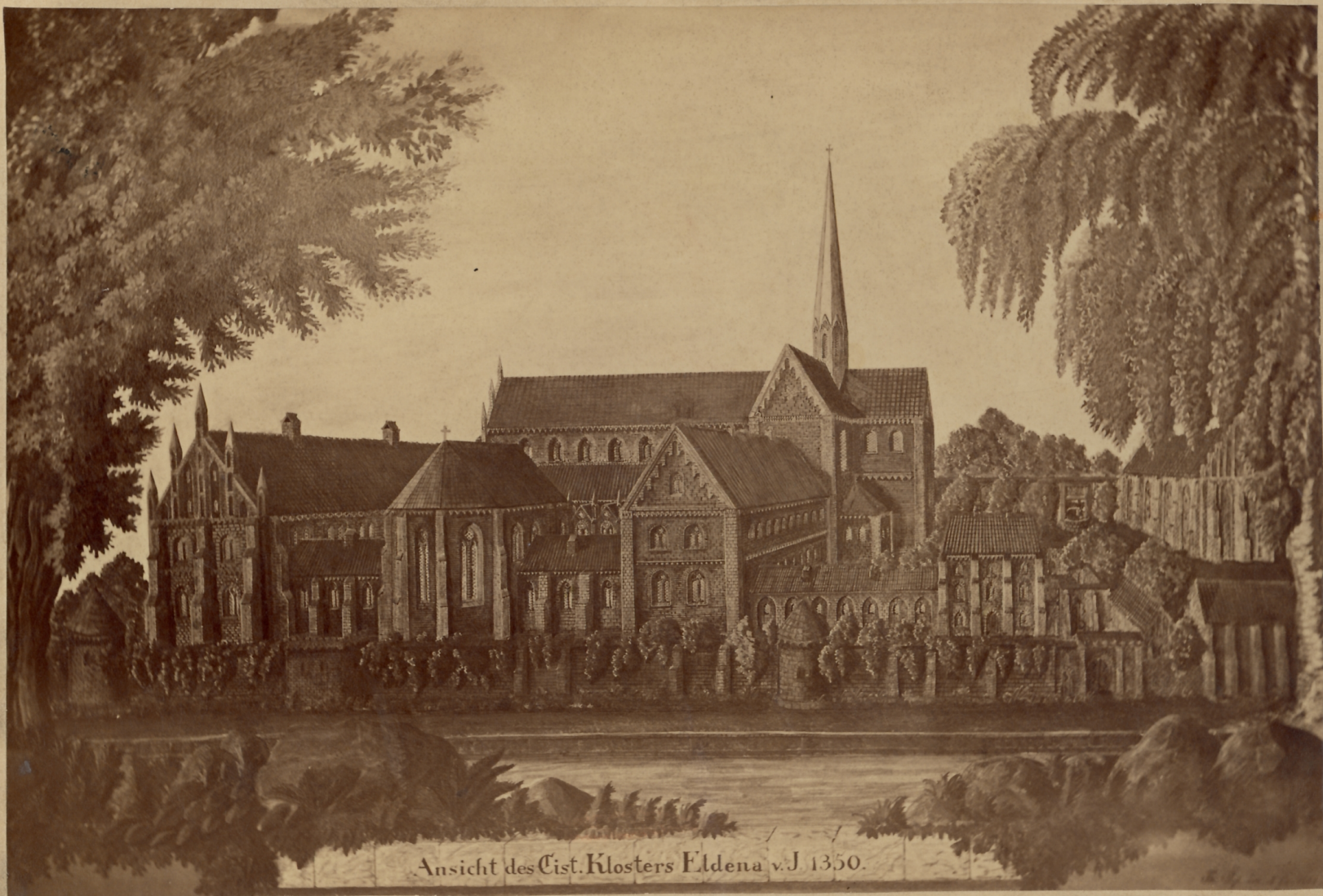
Ansicht des Cist. Klosters Eldena v. J. 1350.